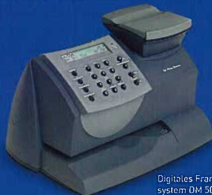
Digitales Frankiersystem DM 50i

Die für Ihr Büro geeignete Maschine finden Sie online unter www.pitneybowes.de . Selbstverständlich beraten wir Sie auch gern persönlich unter Tel.: 0180 1 22 00 33.