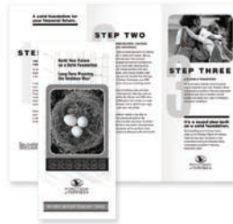
Mittel-, Wickel- und Leporellofalz