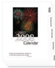
Registerblätter und farbige Trennblätter