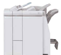
Booklet Maker mit optionalem Wickel- und Leporellofalz