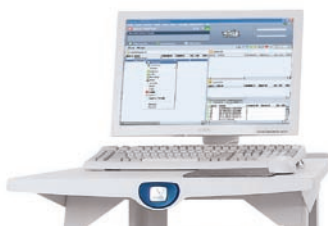
Xerox FreeFlow Print Server