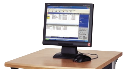
EFI Fiery Druckserver