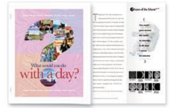
Stapeln und Ingenieur-Falz

Mit der Xerox 4112/4127 erzielen Sie eine größere Leistung. Sie erhalten die Funktionen, um heute eine ganze Reihe gefragter Anwendungen zu erstellen – und morgen innovative und Gewinn bringende Anwendungen zu entwickeln. Im Folgenden finden Sie Beispiele für Anwendungen, die Sie ganz einfach erstellen können, und Geschäftsbereiche, die Sie bedienen können.