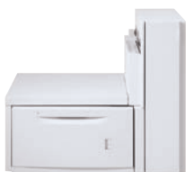
Großraumbehälter für Überformate (2.000 Blatt bis zu 330 x 488 mm)