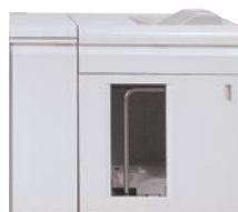
Schnittstellenmodul und Großraumbogenauslage (5.000 Blatt)