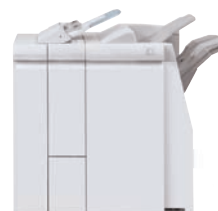
Standard-Finisher mit optionalem Wickel- und Leporellofalz