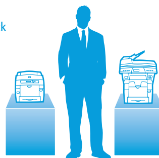
Phaser 8560 und Phaser 8560MFP