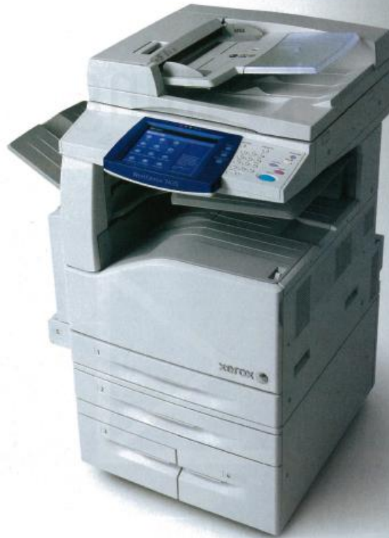
DATENZENTRALE: Mit den multifunktionalen Systemen der WorkCentre-Serie lassen sich Patientendaten verwalten und auf Knopfdruck am Gerät abrufen.

Damit sich die digitalen Informationen im Unternehmensnetzwerk auch schnell wieder auffinden lassen, können die Anwender direkt am Display der Xerox-Multifunktionsgeräte eine so genannte Verschlagwortung vornehmen. Durch die Abfrage von Name, Patientennummer, medizinischer