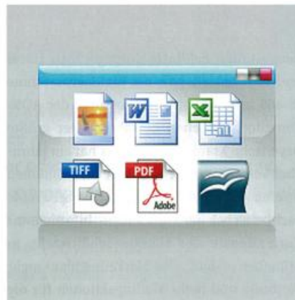
FLEXIBEL: Die digitalisierten Patienteninformationen lassen sich in beliebige Dateiformate am MFP-System abrufen, weiterbearbeiten und für die Visite ausdrucken.